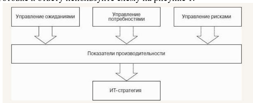
Рисунок 1 – Составляющие ИТ-стратегии

Задача 1. Цели ИТ-стратегии современного предприятия (организации) и решаемые задачи? При подготовке к ответу используйте схему на рисунке 1.